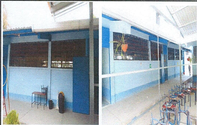
Foto 3: Balcones para los ventanales frontal aula 1, 2 y 3. Instalados